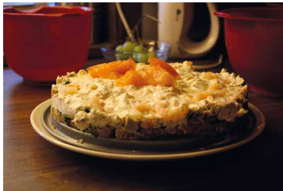
Ekstra bonus: En lakselagkage min mor lavede. Hendes første (og måske eneste) lakselagkage