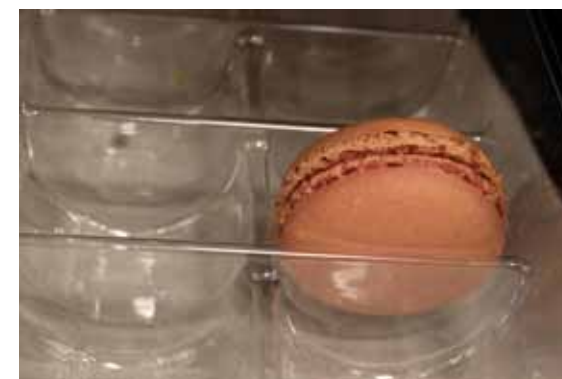
Min første franske macaron