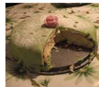
Min første svenske prinsesselagkage