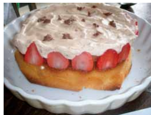
Min første jordbærlagkage med hvid chokolademousse (Jeg kom til at købe noget forkert chokolade så i virkeligheden er moussen lysebrun)