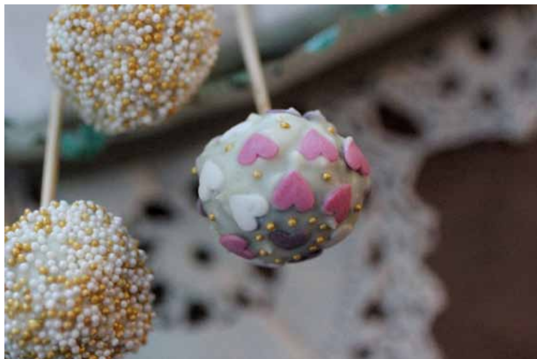
Mine første cakepops