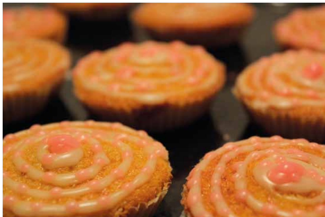
Mine første cupcakes